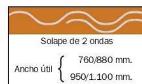
FORMAS DE SOLAPE